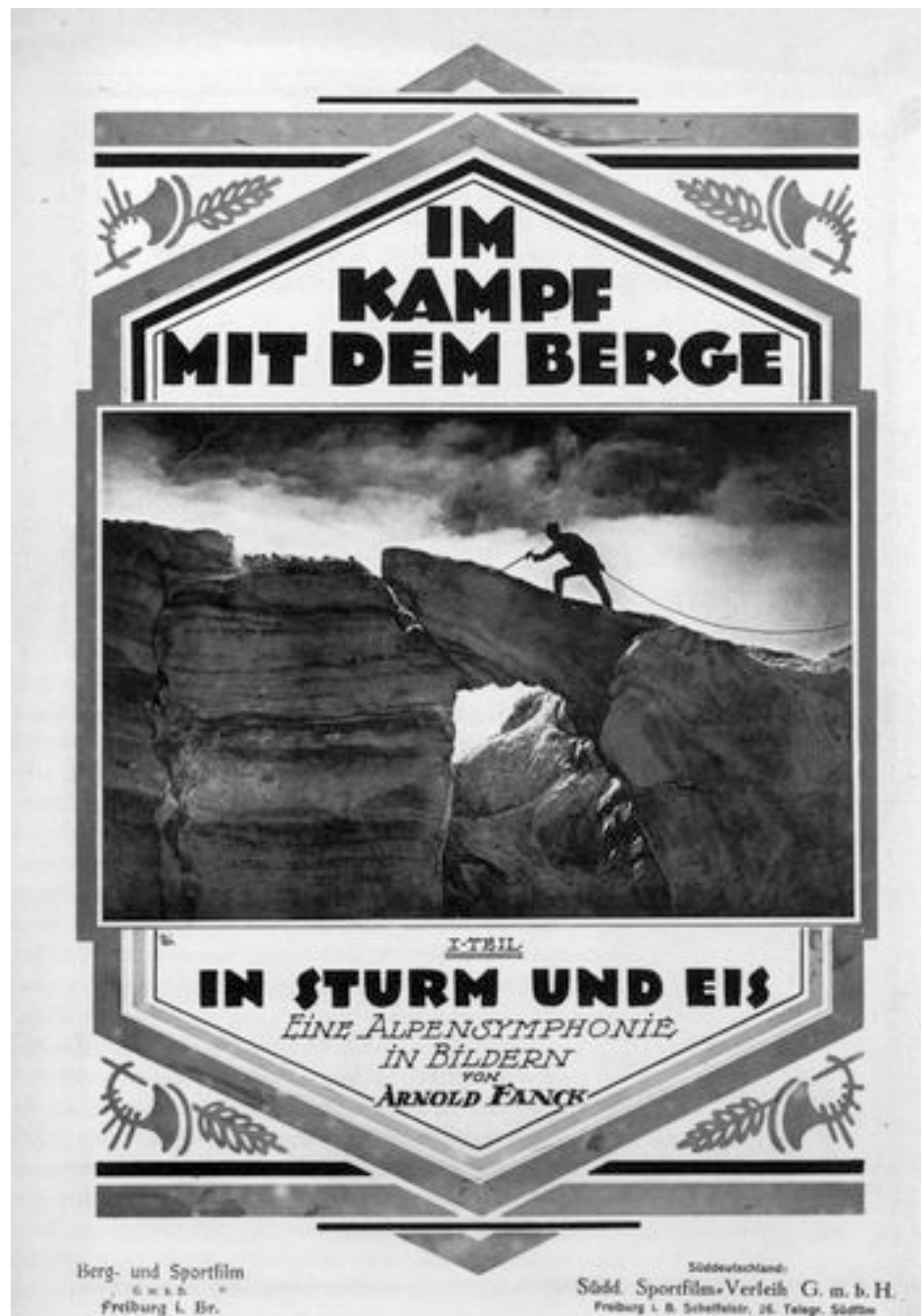
1921, affiche de distribution de la Südd. Sportfilm-Verleih, Fribourg en Brisgau.