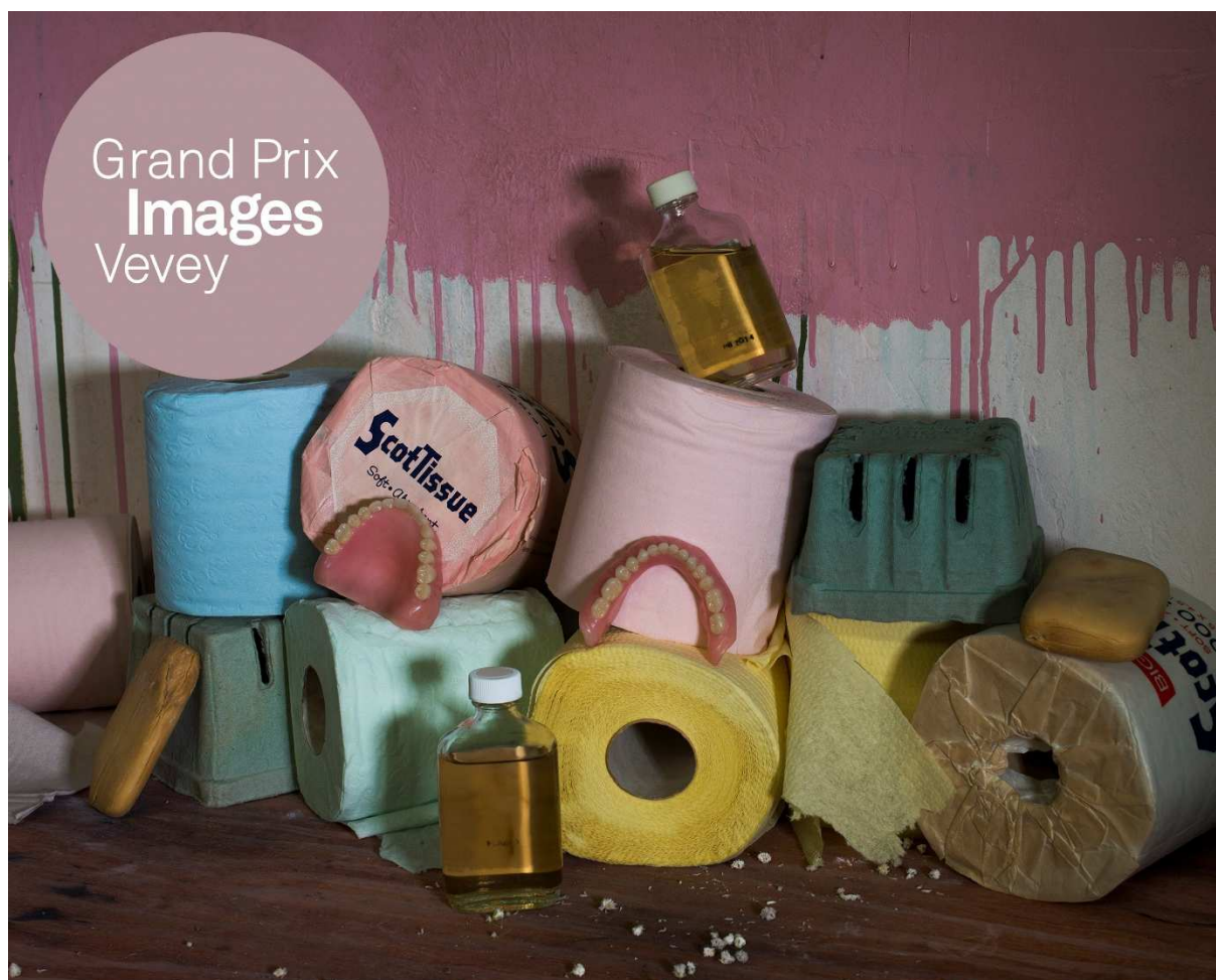
© Christian Patterson, Gong Co. Projet lauréat du Grand Prix Images Vevey 2015/2016

Inscriptions du 12 janvier au 26 février sur www.images.ch