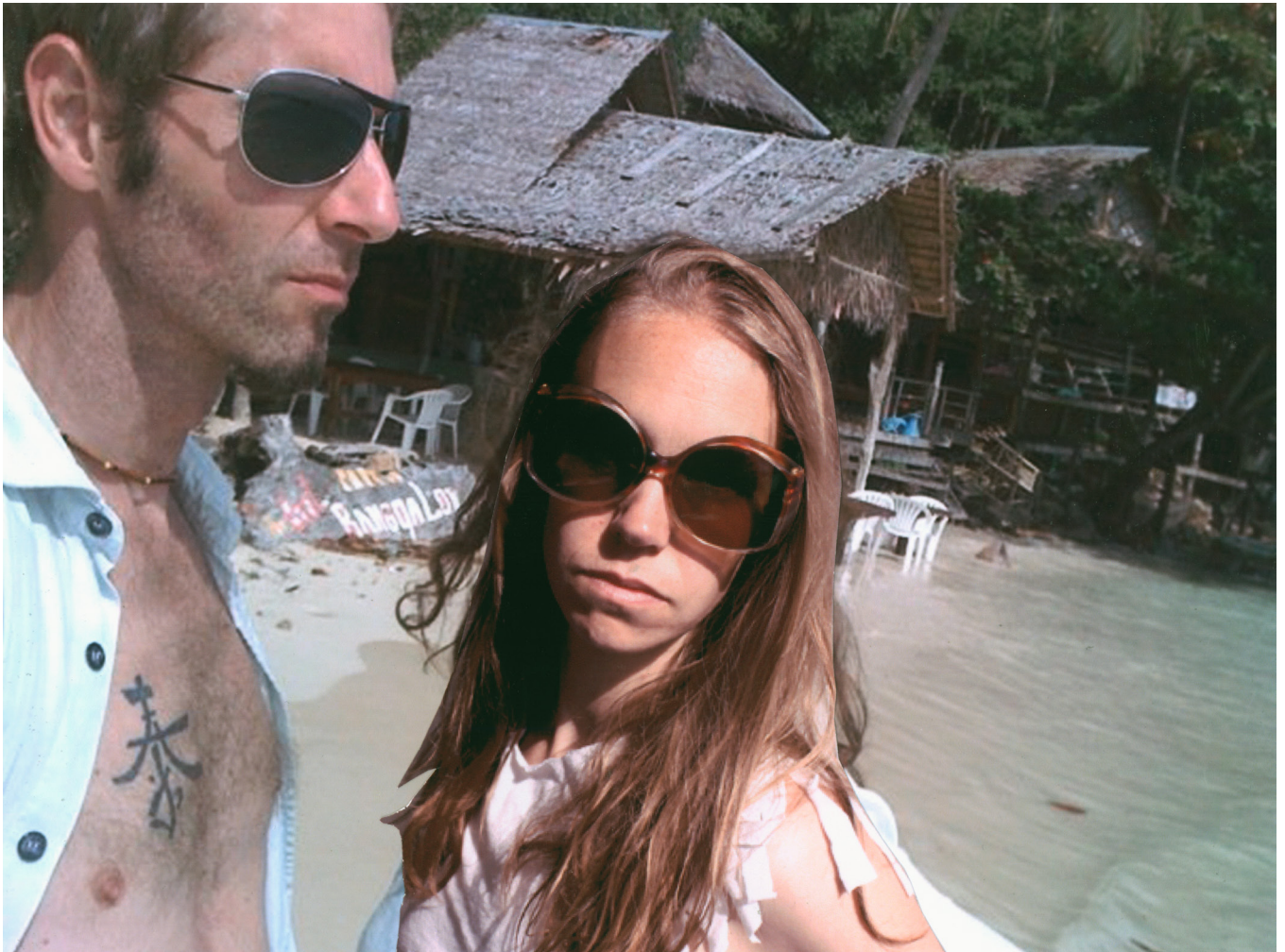
Jenny Rova, I would also like to be - A work on jealousy

Scénographie: Ces clichés sont imprimés sur un papier évoquant celui d'une imprimante domestique et les autoportraits réalisés par l'artiste sont collés par-dessus de manière à évoquer le processus créatif de la série.