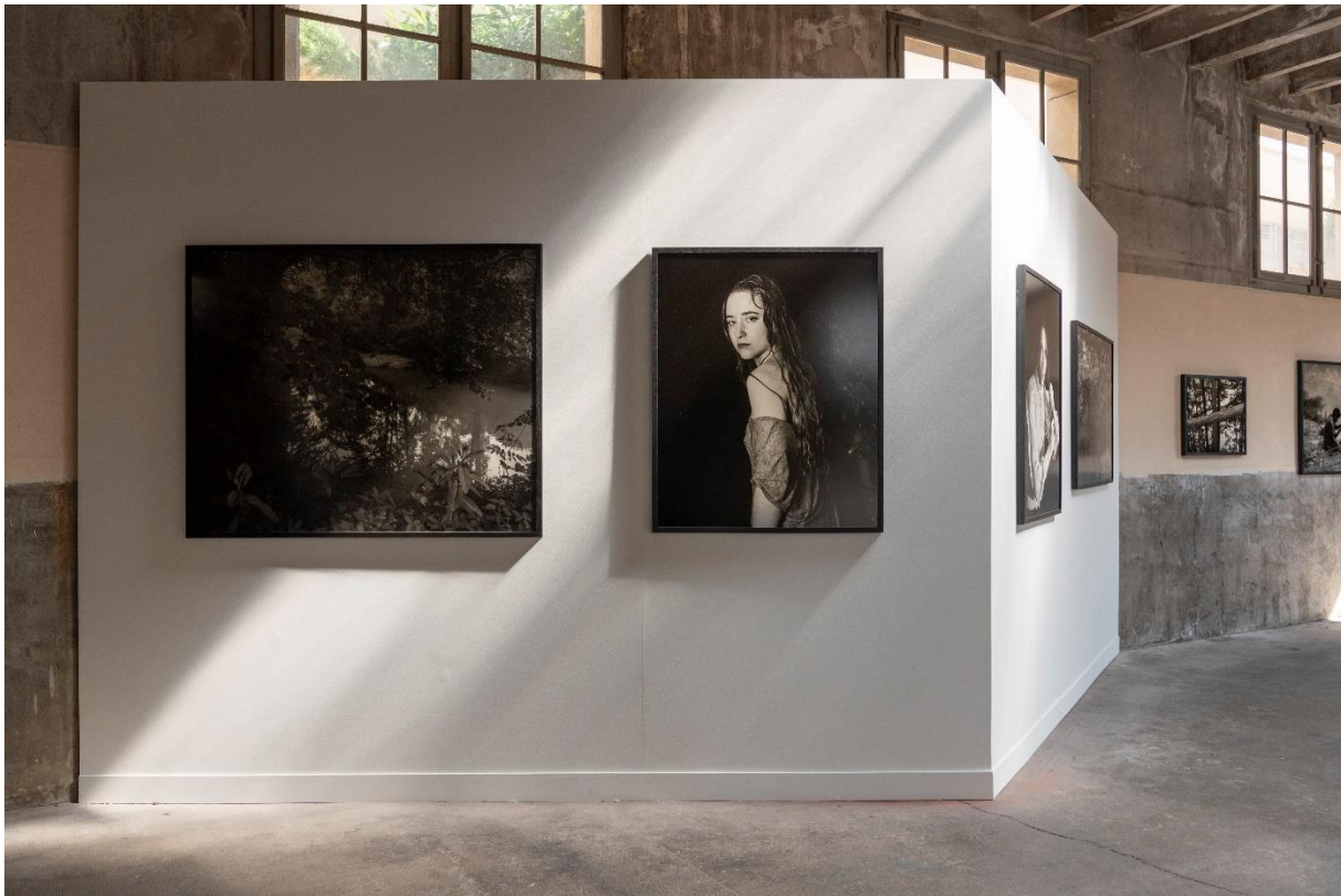
© Mona Joseph. Exposition Dark Waters de Kristine Potter au Festival Images Vevey 2020 Projet lauréat du Grand Prix Images Vevey 2019/2020

Le PRIX DU LIVRE IMAGES VEVEY est un soutien de 10 000 CHF (env. 9250 EUR) à un projet éditorial proposant une adéquation optimale et surprenante entre la forme de la publication et le contenu photographique. Il vise à apporter un complément financier incitant l'artiste à prendre des risques et à innover afin de donner à son projet photographique la forme éditoriale la plus aboutie possible.