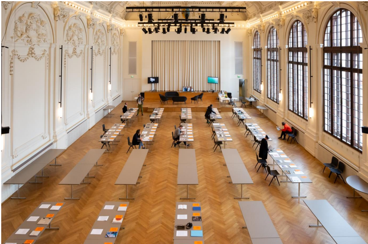
Jury du Grand Prix Images Vevey 2019/2020 dans la salle del Castillo à Vevey

Les projets primés seront réalisés durant l'année et présentés lors du prochain Festival Images Vevey du 2 au 25 septembre 2022 .