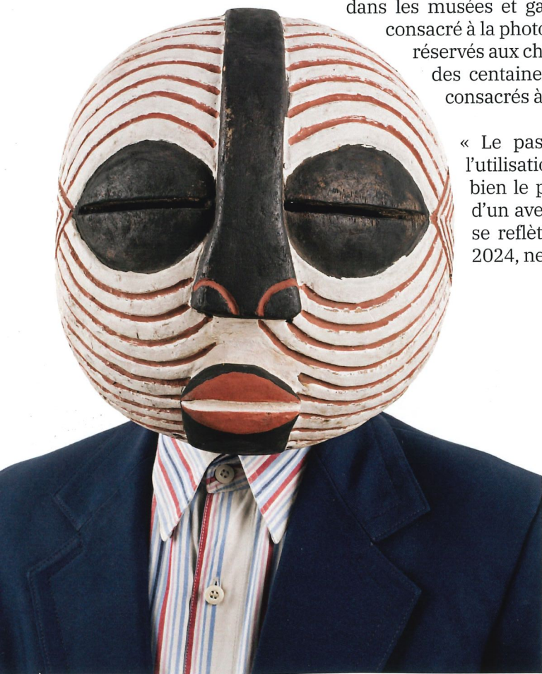
↑ Edson Chagas, Tipo Passe © Edson Chagas - Courtesy of the artist and Apalazzo Gallery, Brescia ; Stevenson Gallery, Johannesburg, Cape Town, South Africa, Amsterdam, Netherlands. Avec le soutien de la Ville de la Tour-de-Peilz