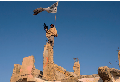
COMBATTANT TALIBAN EN AFGHANISTAN, ALFRED YAGHOBZADEH (2021).