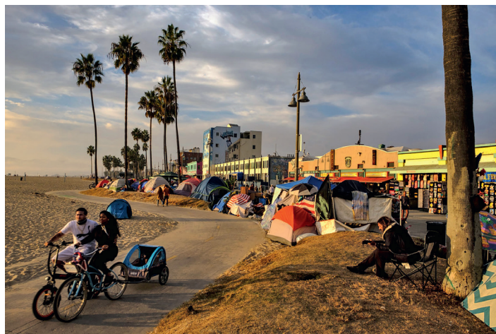
CAMPMENT DE SANS-ABRI LE LONG DE LA CÉLÈBRE PROMENADE DE VENICE BEACH, PENDANT LE CONFINEMENT, KAREN BALLARD (2020).